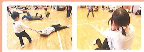
写真:2017年11月11日 西大寺ふれあいセンターでの開催模様