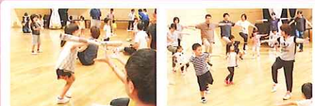
写真:2017年7月1日 西ふれあいセンターでの開催模様