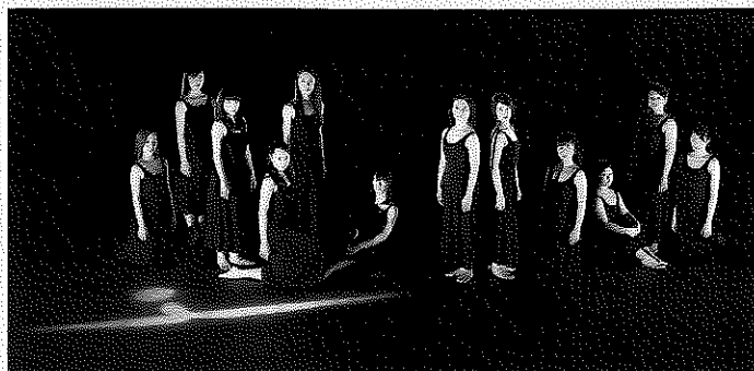
ダンス・インキュベーション・フィールド岡山