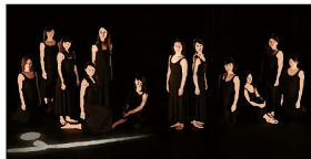
ダンス・インキュベーション・フィールド岡山

多くの人々が行き交うオープンスペースで、県内外のアーティストによる野外ダンスパフォーマンスを中心に、誰もが気軽に文化芸術に触れられるイベントを開催します。ぜひお越しください。