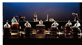
ズンチャチャ × 備中温羅太鼓