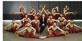
IPU・環太平洋大学ダンス部